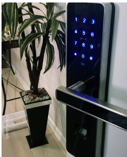
Maquinário da fechadura 6068 em aço inoxidável SUS 304